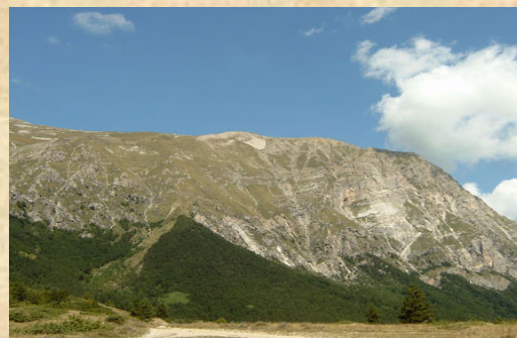
Forca di Presta

La varietà e la ricchezza naturalistica dei suoi massicci e dei diversi versanti, le suggestive testimonianze storico - architettoniche si riflettono in una moltitudine di proposte, itinerari e visite per tutte le stagioni dell'anno.