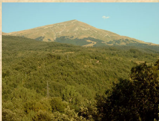
Pizzo di Sevo

La varietà e la ricchezza naturalistica dei suoi massicci e dei diversi versanti, le suggestive testimonianze storico - architettoniche si riflettono in una moltitudine di proposte, itinerari e visite per tutte le stagioni dell'anno.